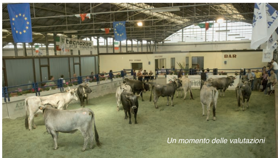
Un momento delle valutazioni

Dal 28 Aprile al 1° Maggio scorsi si è svolta, presso i padiglioni zootecnici dell'Ente Fiere di Foggia, la XII a Mostra Nazionale dei Bovini di Razza Podolica iscritti al LGN. La manifestazione è ritornata a svolgersi in questa sede a 3 anni di distanza dalla precedente edizione ospitata nel 2009. La Nazionale di Foggia ha riportato il "Sistema Podolico" in una delle aree più tipiche della sua culla di origine. Gli allevatori della provincia di Foggia, nella quale sono presenti anche alcuni nuclei delle razze Romagnola e Marchigiana, sono infatti attivi e coinvolti nell'attività di selezione, conferendo regolarmente i loro migliori prodotti al Centro Selezione Torelli di Laurenzana. Inoltre, dopo l'interruzione forzata per motivi sanitari del ciclo di prove di performance per i torelli in test presso il Centro di Laurenzana, la Mostra Nazionale di Foggia ha offerto agli allevatori il mezzo per approfondire le loro conoscenze in materia