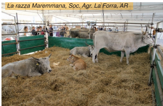
La razza Maremmana, Soc. Agr. La Forra, AR