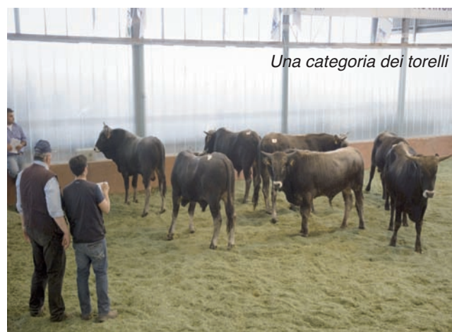
Una categoria dei torelli

Le vicissitudini sanitarie che hanno condizionato la sospensione del 16° ciclo di prova per i torelli test