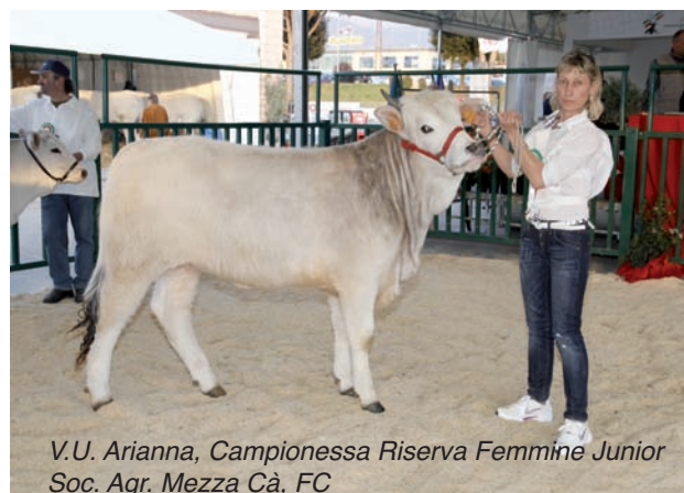
V.U. Arianna, Campionessa Riserva Femmine Junior Soc. Agr. Mezza Cà, FC