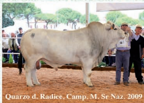
Quarzo d. Radice, Camp. M. Sr Naz. 2009