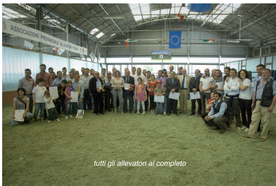
tutti gli allevatori al completo