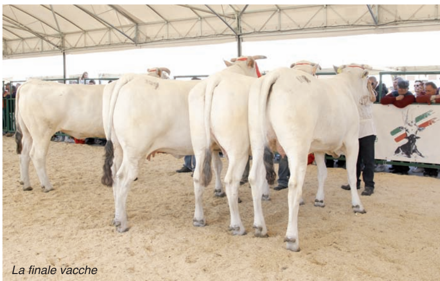
La finale vacche