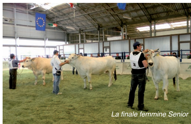
La finale femmine Senior