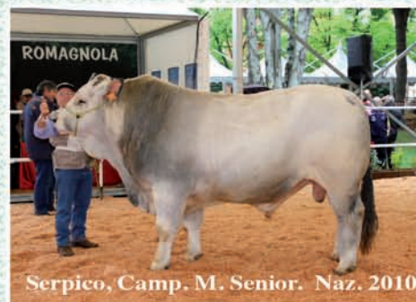
Serpico, Camp. M. Senior. Naz. 2010