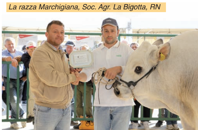
La razza Marchigiana, Soc. Agr. La Bigotta, RN