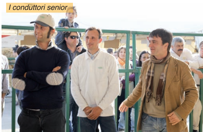
I conduttori senior