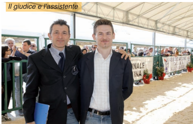
Il giudice e l'assistente